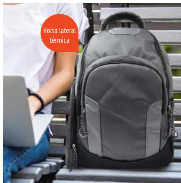
MAL 616 Backpack Sampras