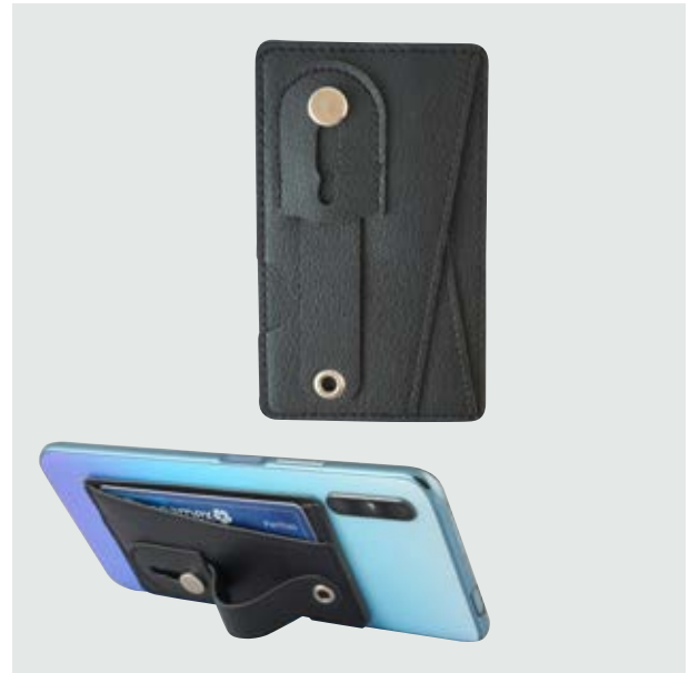
TEC 244 Tarjetero Hook

Material: Plástico y Silicón Medida: 6.2 cm diámetro