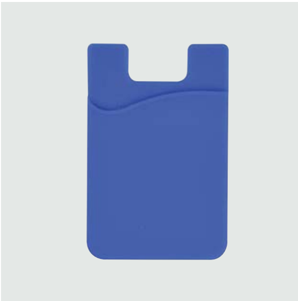
TEC 252 Mobile Stark