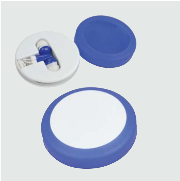
TEC 02 Earbuds Kepler