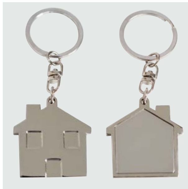
LLA 29 Llavero Forma Casa