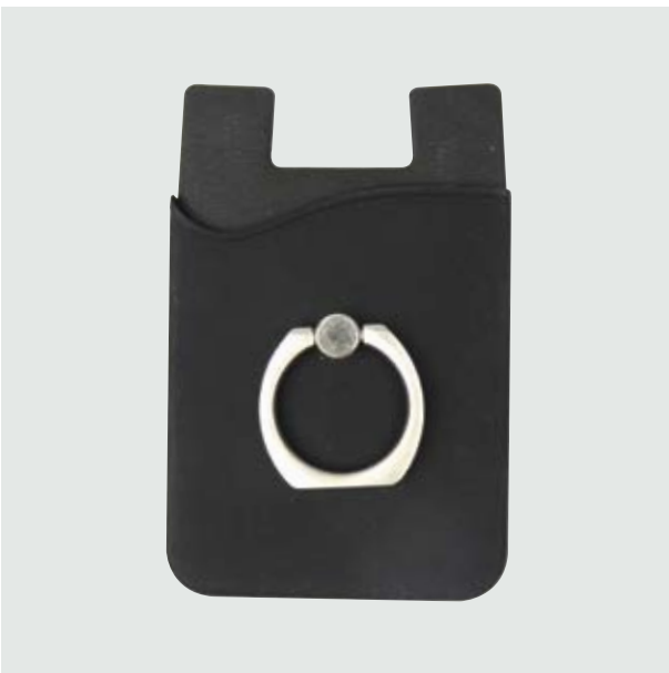
TEC 257 Mobile Tesla