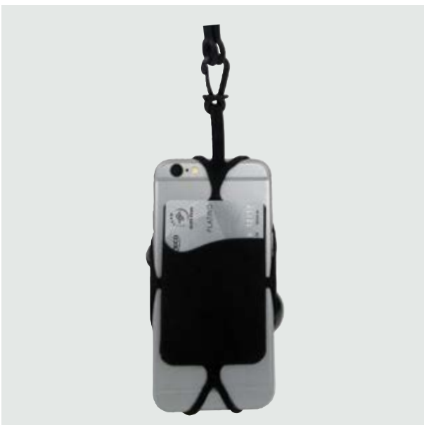
TEC 264 Porta-Celular Kelvin