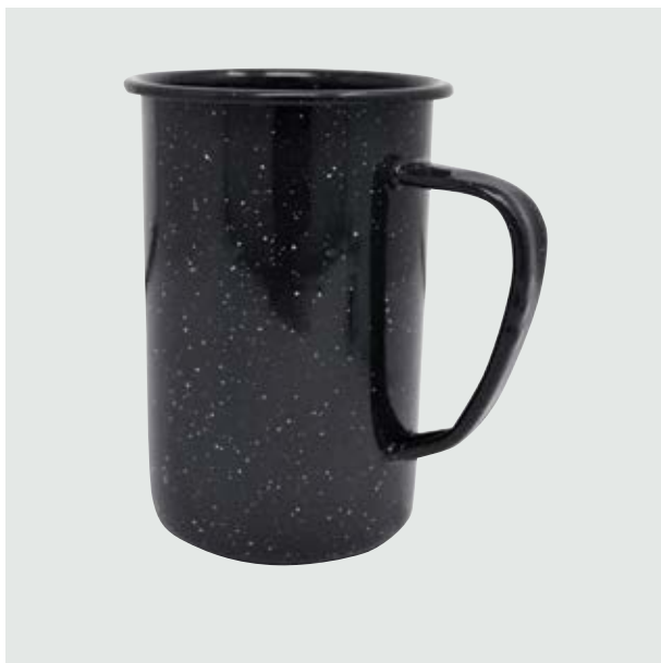
TH 213 Tarro Cervecerero